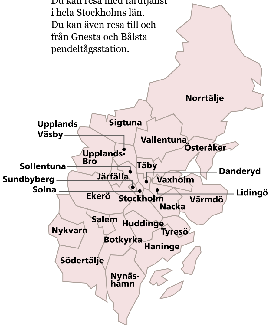
Illustrerad karta över Stockholms län.

Du kan även resa till och från Gnesta och Bålsta pendeltågsstation.